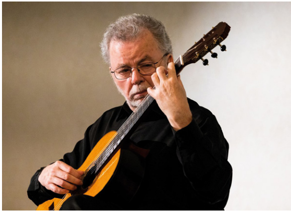
Manuel Barrueco im Kaisersaal, Kurfürstliches Schloss Koblenz, 2023